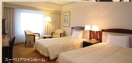
スーペリアツインルーム

ホテル日航関西空港 TEL 072-455-1111(代表) http://www.nikkokix.com